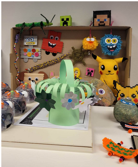
Illustrasjon 8 Eksempler på hva elevene har laget på en av SFOene vi har besøkt

eller dyr». Altså ... Så kommer jeg med noen stikkord på hva de kan søke på eller har i bakhodet. Og plutselig er det sånn «åh, jeg vil gjøre sånn og sånn og sånn. Kan jeg få til det?» «Da kan du printe ut bilde og ta lysbilde. Tegne over. Og her har du designet.» (Ansatt i SFO)