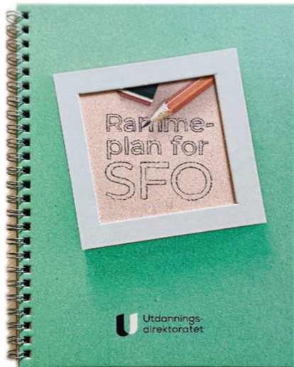
Illustrasjon 1 Rammeplan for SFO

Rammeplanen tar i første del opp skolefritidsordningens verdigrunnlag, der barndommens egenverdi løftes frem sammen med stikkord som trygghet, omsorg og trivsel, mangfold og inkludering, skaperglede, engasjement og utfordretrang, demokrati og fellesskap og bærekraftig utvikling.