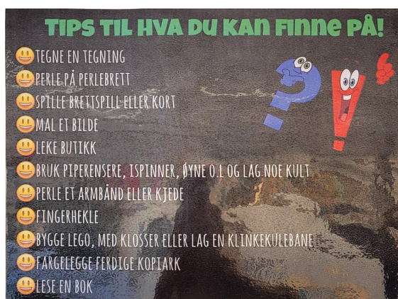
Illustrasjon 7 Liste med inspirasjon til aktiviteter i SFO

Styrt aktivitet, fri lek og forholdet mellom dem er et tema som kommer frem i casestudiene. På den ene siden ser det ut til at styrt aktivitet er en forventning fra både barn og foresatte og nødvendig for å skape et attraktivt tilbud. Samtidig ser det ut til at barna ofte gjerne kan ønske seg fri lek. Et av intervjuobjektene beskriver det slik: