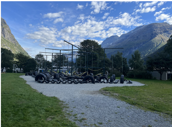
Illustrasjon 10 Felles uteområde for SFO og skolen ved en av case-skolene

Flere av case-skolene har også mindre områder med skog der det er kupert og ulendt terreng. Dette tilsier imidlertid ikke at barna også er fysisk aktive, da de selv kan velge om de vil engasjere seg i aktiviteter, og hvilken type aktivitet de vil engasjere seg i når de utendørs. Studier har vist at tilgang til ulike former for utstyr og leker er avgjørende for at barna skal være fysisk aktive når de er ute (Lund & Lødal, 2017).