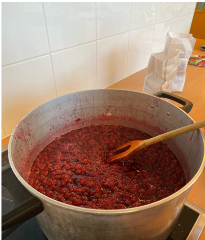
Illustrasjon 9 Matlaging på SFO- syltetøy kokes, på bær som ble plukket ute dagen før

Det er ingen av SFO-ene vi besøker hvor barna er direkte involvert i matlaging til måltidene. Flere SFO-er tilbyr derimot matlagingskurs. Gjennomgående beskrives dette tilbudet som veldig populært hos barna.