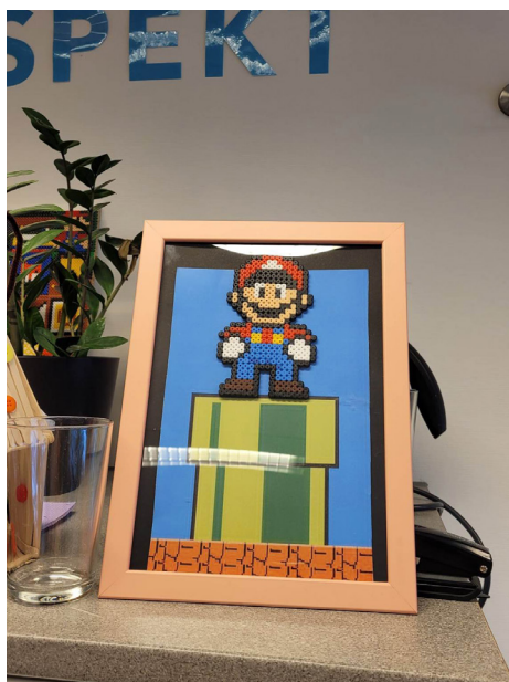
Illustrasjon 3 Perlet figur fra en SFO vi har besøkt