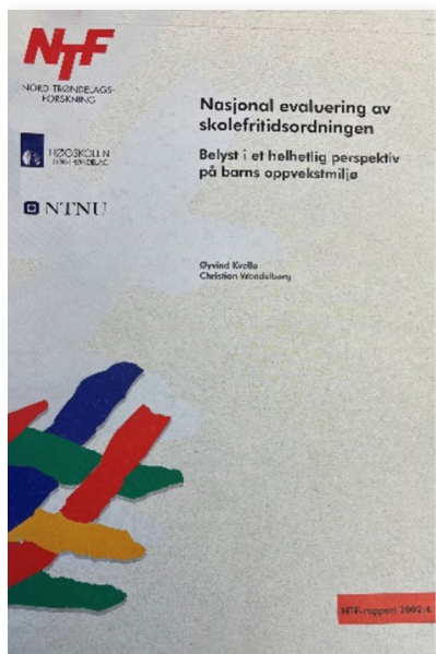
Illustrasjon 2 Evalueringen av skolefritidsordningen i Norge fra 2002

SFO har fått gradvis mer oppmerksomhet de senere årene. SFOs historie går langt tilbake, men det er særlig i tilknytning til reform 97 og innføringen av skolestart for seksåringer at oppmerksomheten virkelig tok seg opp (Kirke-, undervisnings- og forskningsdepartementet, 1996), og i 2002 fikk vi den første evalueringen av SFO-ordningen (Kvello & Wendelborg, 2002).