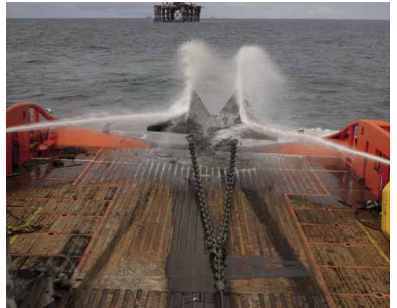
IKKE RAPPORTERT: Funnene viser at fartøy som er i spotmarkedet rapporterer nestenhendelser og småskader i mindre omfang enn fartøy som går på lang kontrakt.