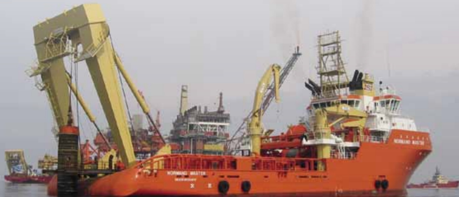
SPOTSIKKERHET: Oljeselskapene inkluderer fartøy på fast kontrakt i sikkerhetsarbeidet, slik er det ikke med spotmarkedet. Det kan få konsekvenser for sikkerhetsarbeidet på fartøy i spotmarkedet.